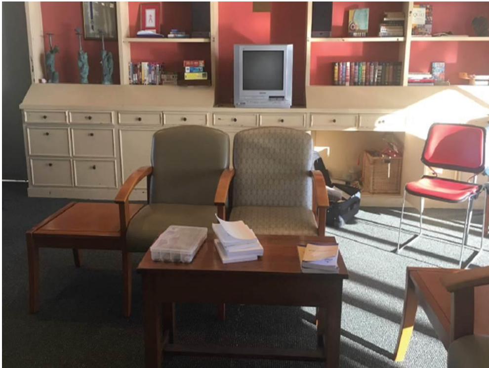
San Francisco USA. Sábado 9:00 am (¡Envíe a Ensayo una fotografía de su espacio de reunión!)